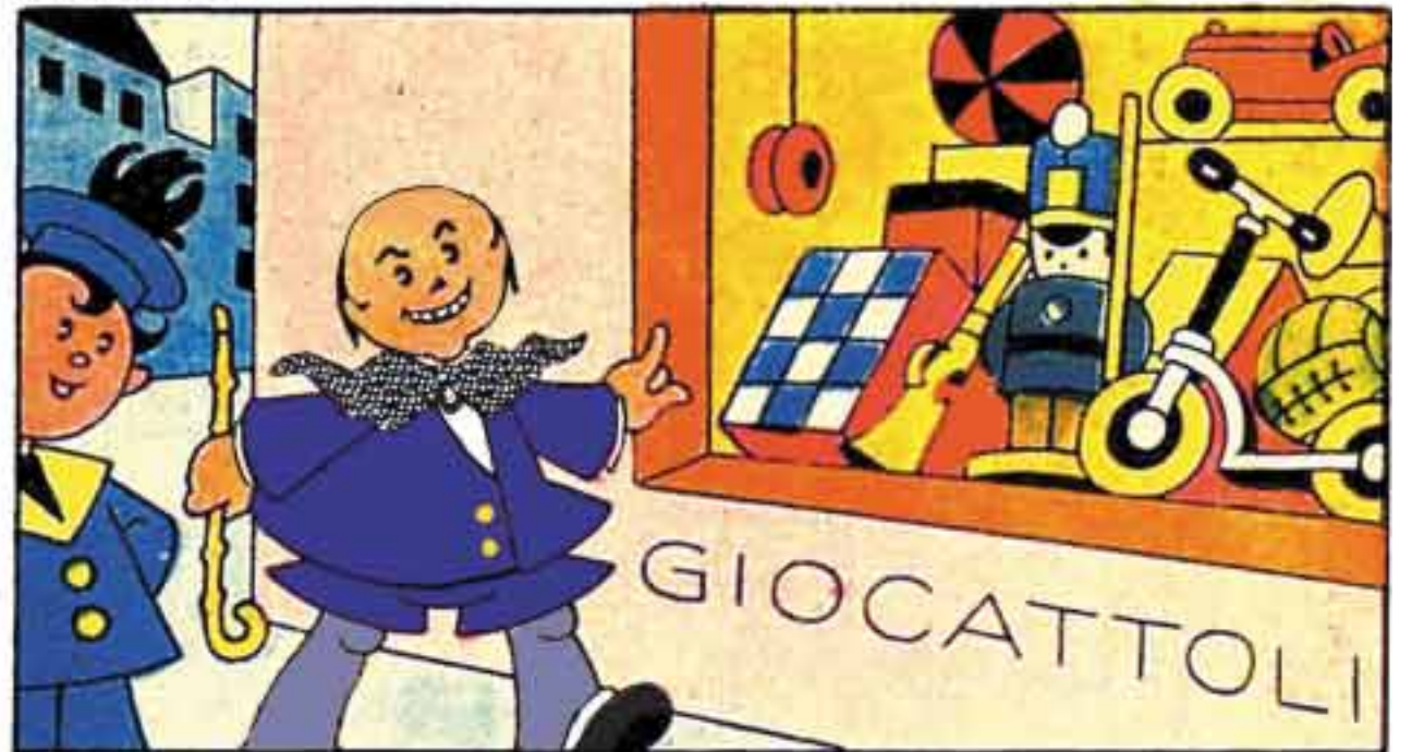
2 Tanto, pensa, per Natale dell'Europa i Governanti mi faran, com'è usuale, di regali tanti e tanti.