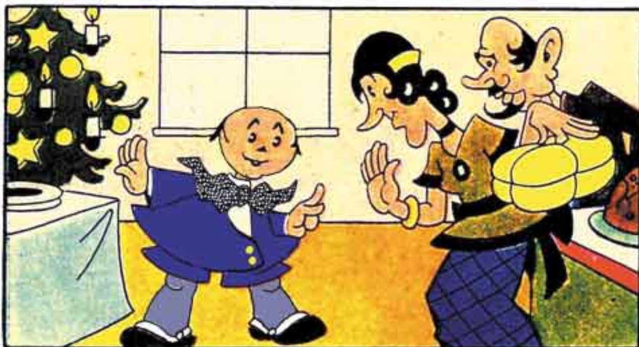
5 Reca il dono la Germania e a Silvietto tutto ansante dice: "Frena la tua smania, l'apriremo allo spumante."