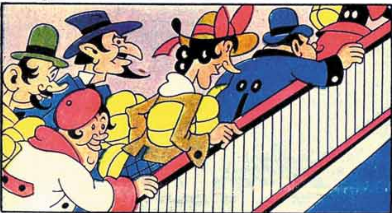
3 Coi regali per le scale ora salgon un po' asmatici per il pranzo di Natale dell'Europa i diplomatici.