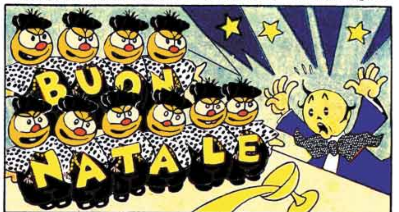
8 "Mamma mia, mi sento male!" Urla Silvio, poverino! I regali di Natale? Dieci volte il burattino!

(Ignobile manipolazione di Sergio Staino su una splendida tavola di Antonio Rubino del 1932)