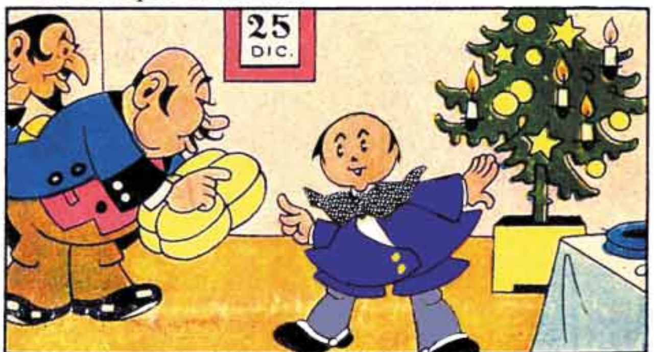
4 Ecco il Belgio e il suo paccone, come vuol la tradizione dice a Silvio: "L'ansia frena, l'aprirai dopo la cena!"