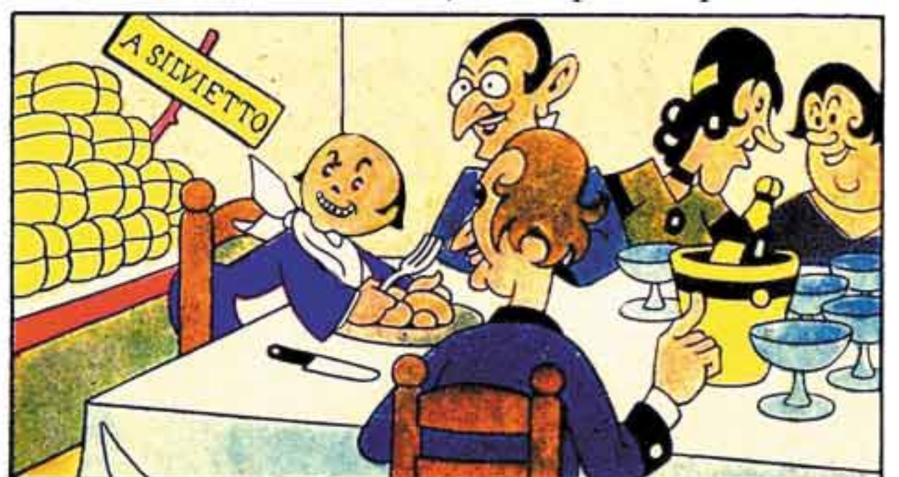
6 E così ogni ambasciatore, Portogallo, Francia, Spagna... "Li apriremo tra due ore" dicono tutti, "Adesso magna."