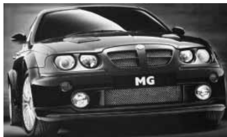
Ecco qualcuna delle tante protagoniste che debutteranno nel 2002. Dall'alto, in senso orario: l'originalissima Citroen C3, l'ammiraglia Lancia Thesis (accanto al titolo), l'Alfa 156 GTA prima di una serie di sportive con questa sigla, la Peugeot 307 station wagon e la MG ZT al top della nuova gamma di berline sportive inglesi