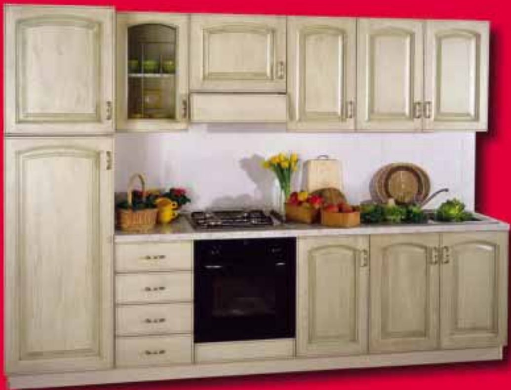
cucina TOSCA € 1.100,00* L. 2.129.897 come foto, solo mobili