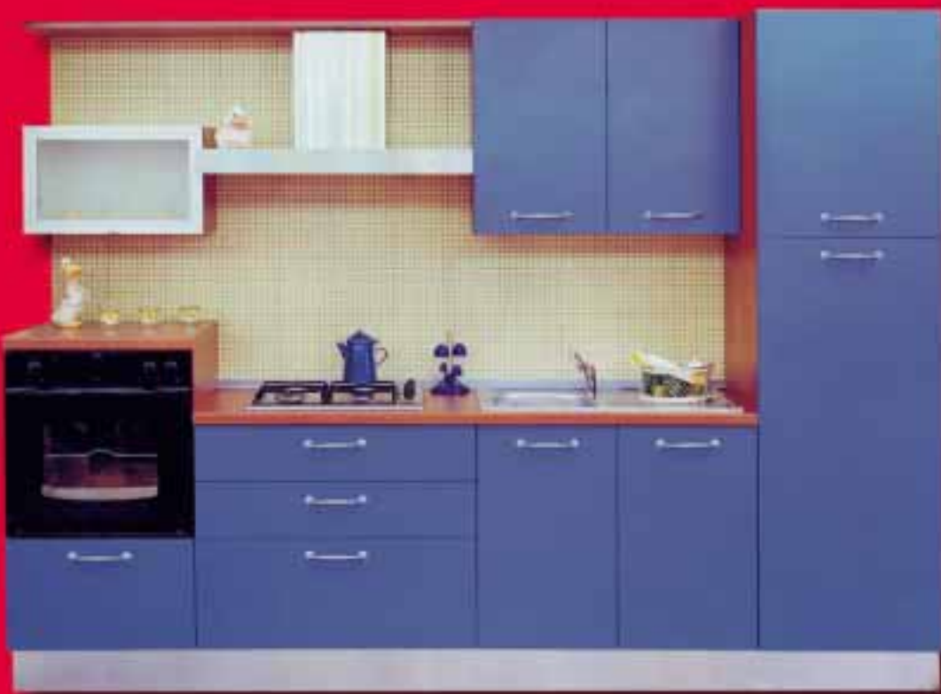
cucina SMILLA € 901,00* L. 1.744.579 come foto, solo mobili