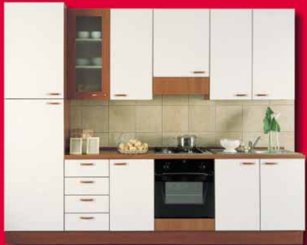
cucina ALENA € 509,00* L. 985.561 come foto, solo mobili

+ OFFERTA TRIS ELETTRODOMESTICI: FRIGO 230 LT. + FORNO da 60 + PIANO COTTURA 4 Gas A € 490,00 L. 948.772