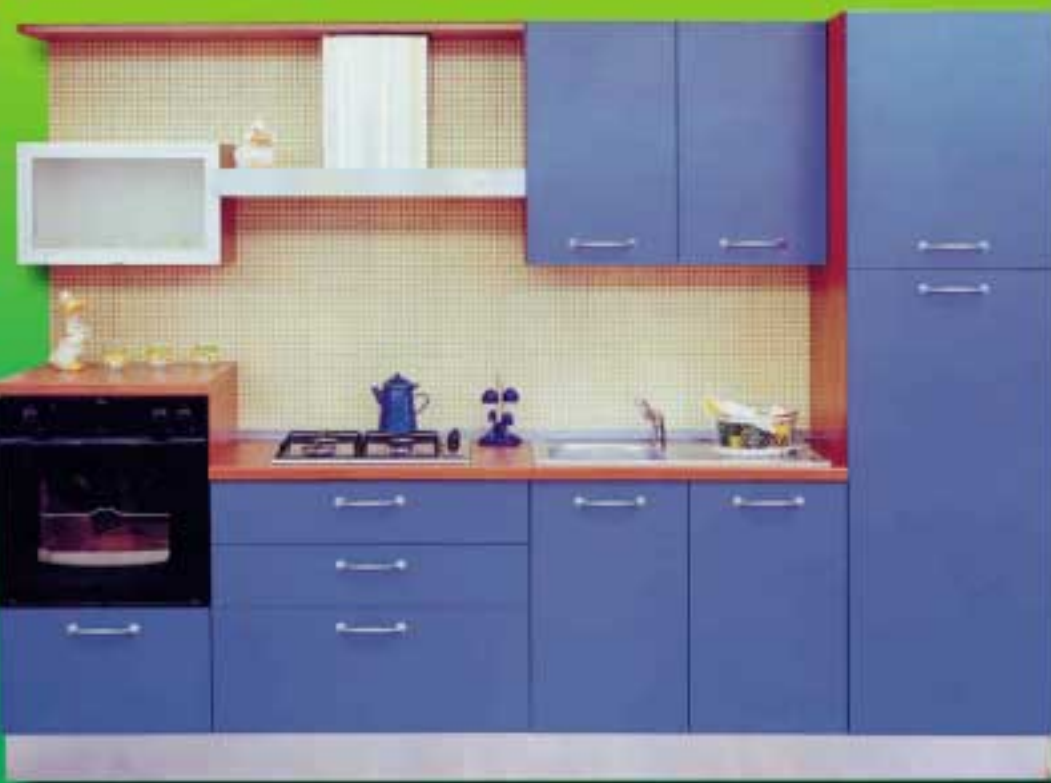
cucina SMILLA € 901,00* L. 1.744.579 come foto, solo mobili