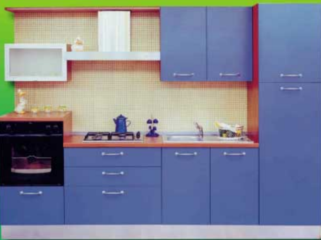
cucina SMILLA € 901,00* L. 1.744.579 come foto, solo mobili