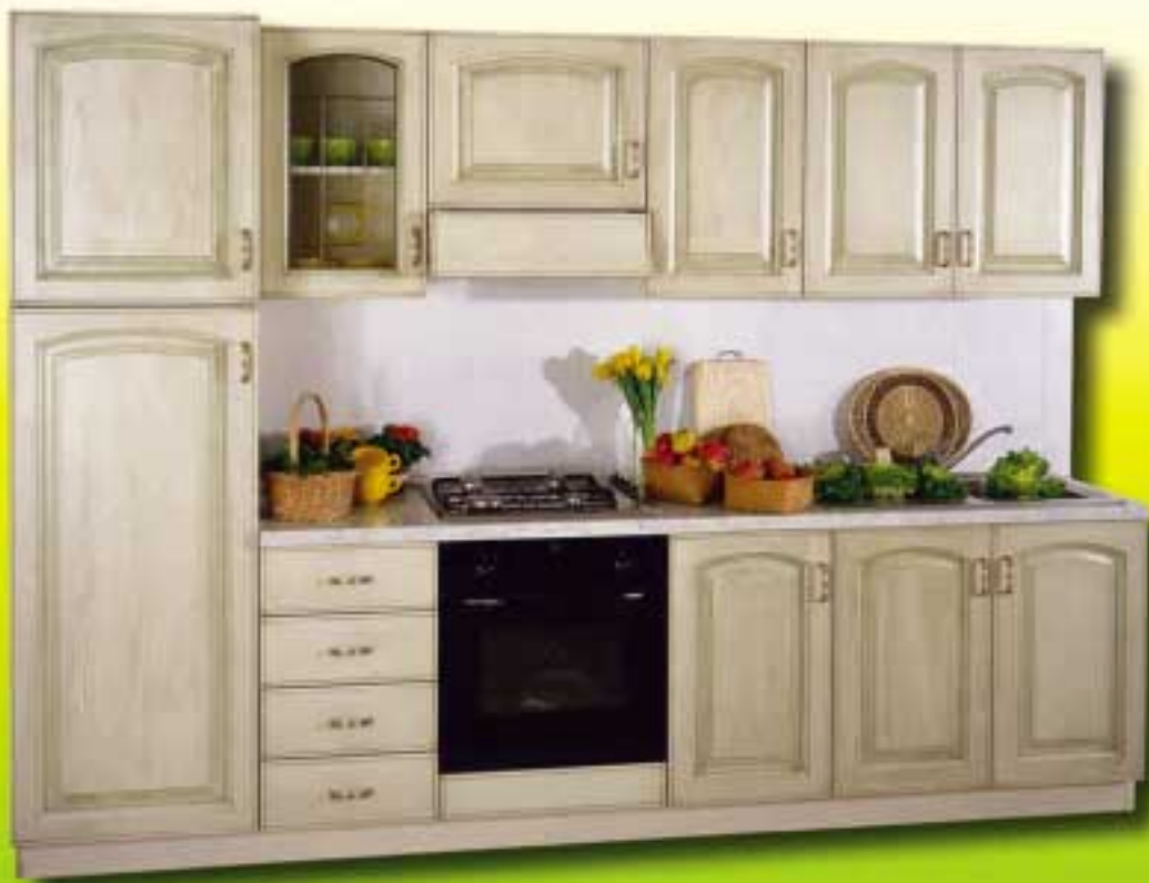
cucina TOSCA € 1.055,00* L. 2.042.765 come foto, solo mobili