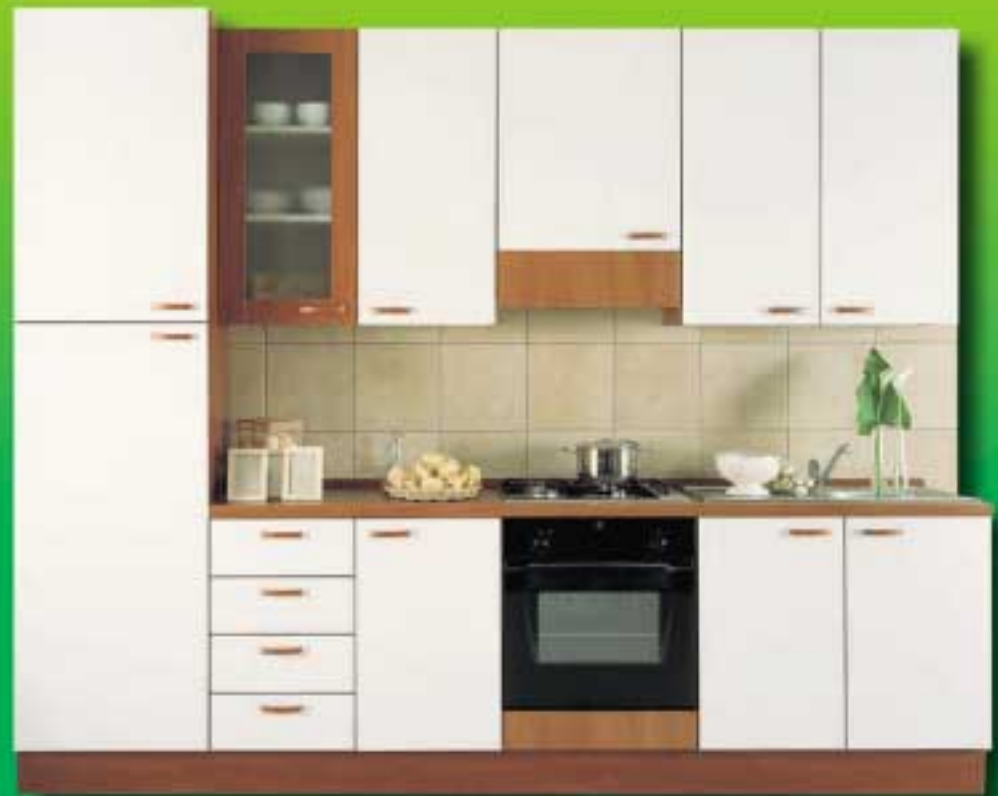
cucina ALENA € 509,00* L. 985.561 come foto, solo mobili