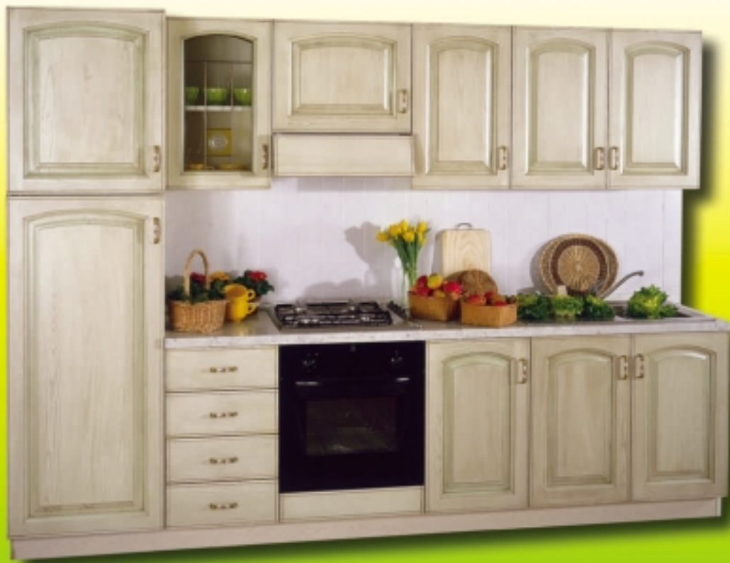
cucina TOSCA € 1.100,00* L. 2.129.897 come foto, solo mobili