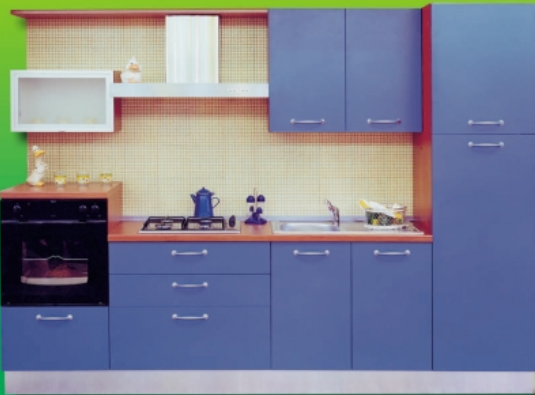
cucina SMILLA € 901,00* L. 1.744.579 come foto, solo mobili