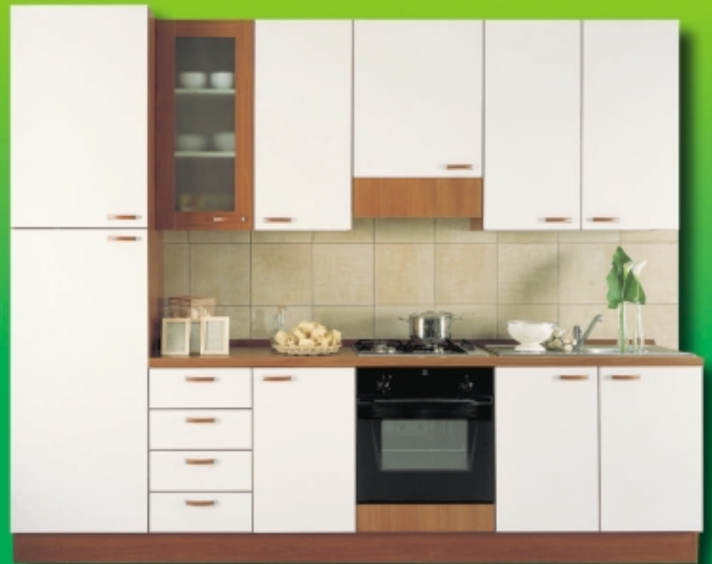
cucina ALENA € 509,00* L. 985.561 come foto, solo mobili

+ OFFERTA TRIS ELETTRODOMESTICI A € 490,00 L. 948.772 FRIGO 230 LT. + FORNO DA 60 + PIANO COTTURA 4 GAS prezzo d'acquisto abbinato con le cucine