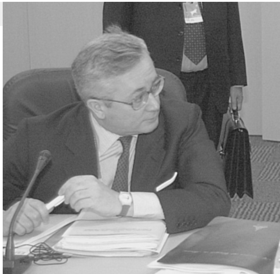
Il Ministro dell'Economia Giulio Tremonti

È per questo che sul cammino dei nuovi enti voluti da Tremonti si addensano anche nubi «amiche», oltre al fronte delle Regioni «nemiche». Ragione per cui i regolamenti attuativi, attesi in questi giorni, tardano ad arrivare. Tremonti dice di averli nel cassetto. Perché non escono? Troppi interessi da accontentare. Messo il bavaglio alle Regioni del Polo, resta la Lega a reclamare più «poltrone» (il 75%