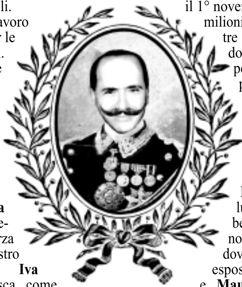
Il Presidente nel giorno della Sua Incoronazione

oppresso. Abbiamo veduto trionfare i monopolisti, ricostituirci le caste di privilegiati, rinascere l'autorità indebita. "La sua scomparsa ci lascia più forti", ha detto infine la Carlucci , un mese di onoranze, nella cerimonia collettiva che si svolgerà il 1° novembre, quando 80 milioni di italiani, alle tre di pomeriggio, dovranno interrompere ogni attività per pensare a uno spot pubblicitario purchessia, in silenzioso omaggio alla memoria del grande cavaliere. Le spoglie di Berlusconi dovrebbero giungere stanotte al Quirinale dove resteranno esposte finché l'odore e Maurizio Costanzo lo consentiranno. E' prevista un'affluenza di milioni di persone. Giorgio Gori , esperto di audience, ne è convinto. Basta dare alla gente quello che la gente vuole. Fissate per dicembre le nozze fra Veronica Lario e Massimo Cacciari . (D.L.)