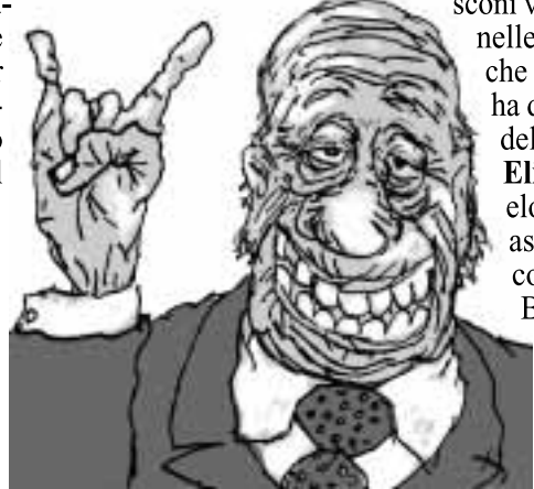
L'ultima foto del Presidente Berlusconi

ROMA, 29 (Ansa, Ap.). Il primo giorno senza Berlusconi ha visto come un ripiegamento dell'Italia su se stessa, mentre dagli schermi televisivi il canale unico diffonde ininterrottamente le note dell'inno di Forza Italia, rallentate in una esecuzione solenne e maestosa dal maestro Pregadio . Il grande e amato leader del nostro partito, del nostro esercito e del popolo del nostro Paese, Silvio Berlusconi, è morto, dice il comunicato letto alla radio dal portavoce di Forza Italia, Francesco Rutelli . La profezia popolare secondo cui le mete-