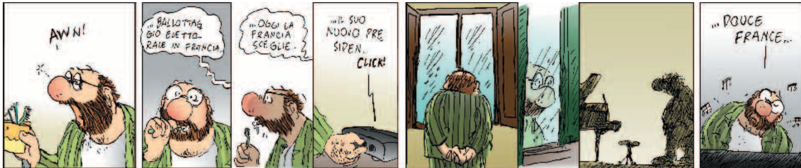
Domenica 5 maggio 2002, ore 0,30...