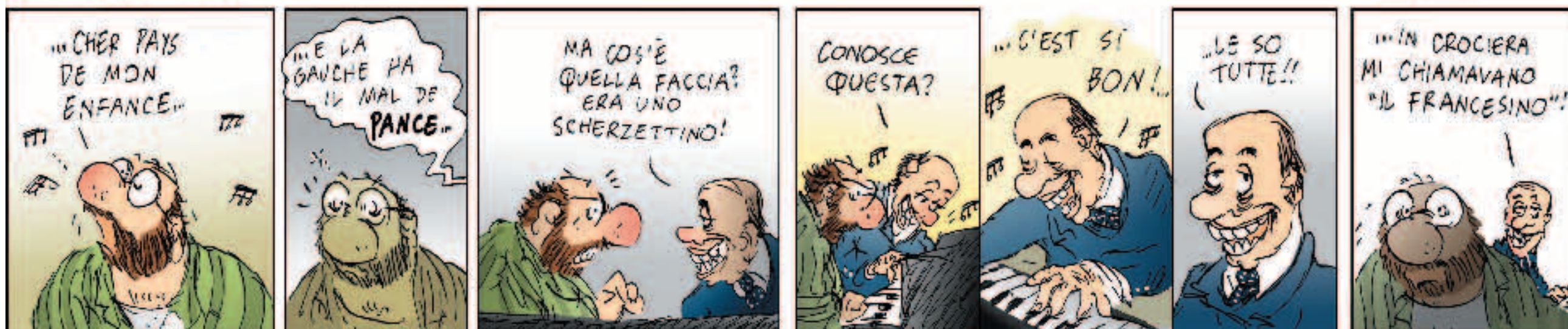
...caro paese della mia infanzia...