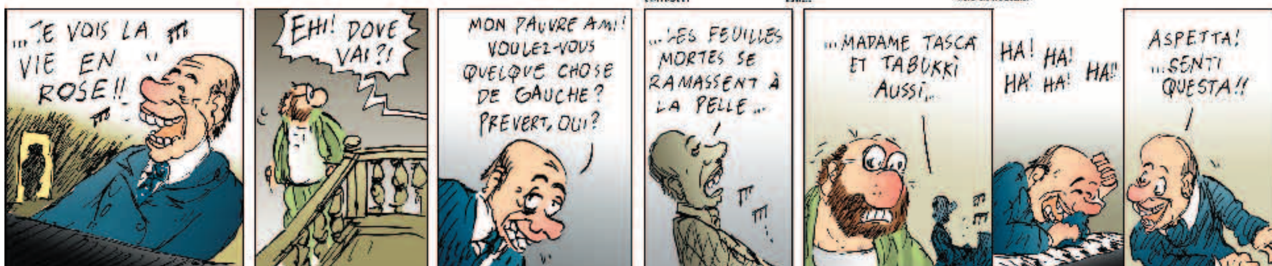
...vedo la vita color di rosa...