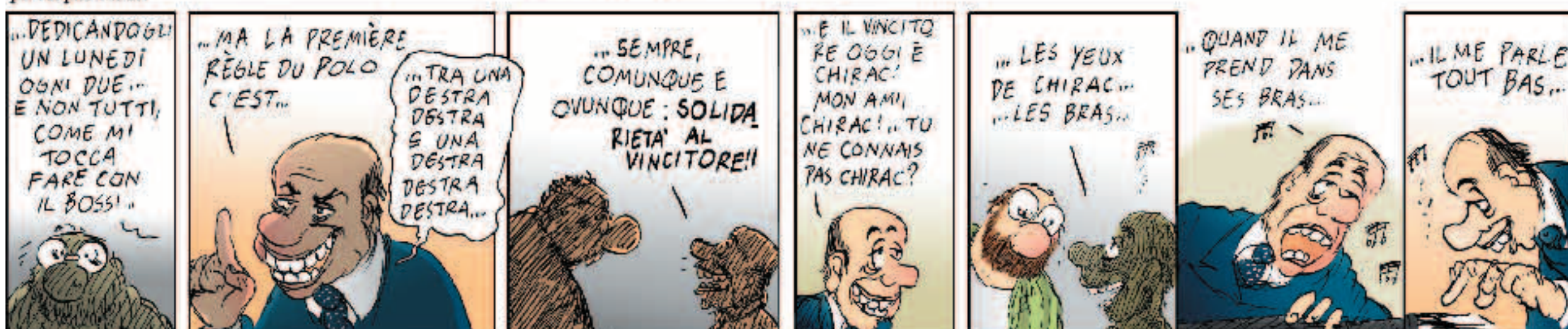
Ma la prima regola del Polo è...