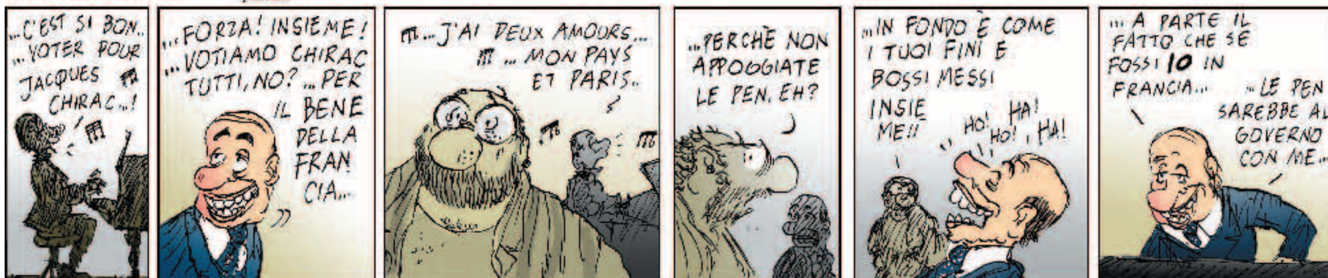
E' così bello... votare per Jacques Chirac!