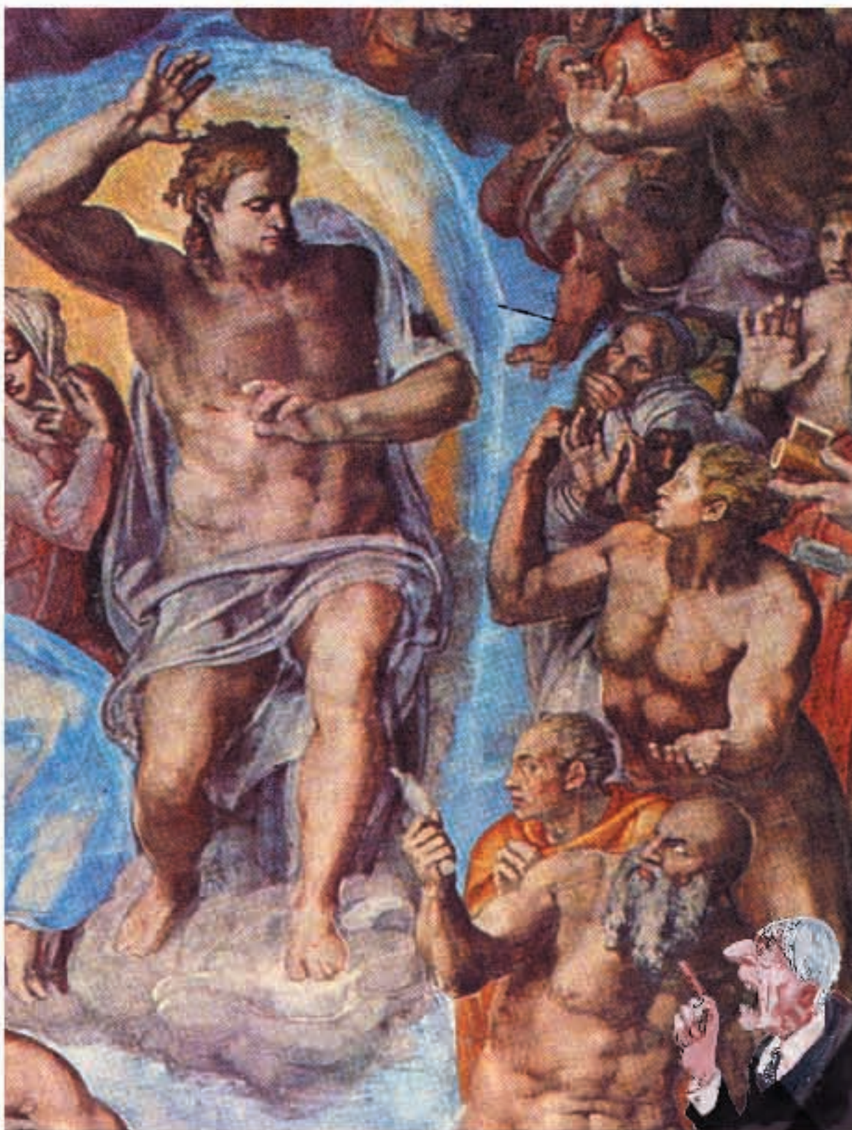
UN GIORNO ACCADRA'

Berlusconi: "Ah, il Parlamento!... proprio come lo lasciai dopo la prima legislatura!"