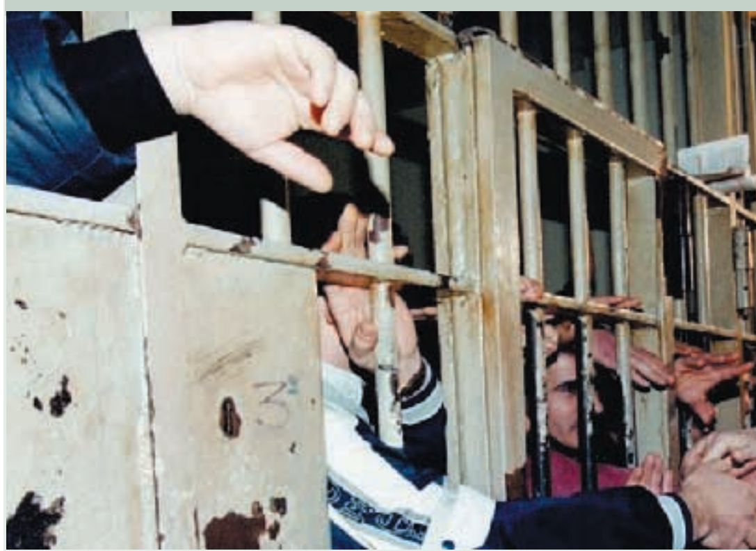
Sofri dal Grand Hotel di Pisa: «Sulle carceri Castelli non sa nulla»