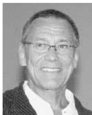
Peter Mullan e Andrej Konchalovskij. In alto, una scena dal film «The Magdalene Sisters»

VENEZIA Un coro di dissensi al Leone d'oro di Magdalene . Tra le prime reazioni quella del cardinal Ersilio Tonini, che ammette di non aver ancora visto il film ma parla di calunnie del regista: «Nella mia vita ho conosciuto orfanotrofi, bambini abbandonati e ho visto i sacrifici che dovevano fare i sacerdoti per mantenerli. Può darsi che ci siano state ferite e errori specifici, ma paragonare i cattolici ai talebani è una tesi davvero calunniosa e mi chiedo se chi ha dato il premio sia reso conto di quel che significa». E ancora: «Una grandissima amarezza. Il Leone è un film che non dice la verità sulla Chiesa e ha un regista che si esprime in modo calunnioso contro i cattolici non rende onore alla Mostra di Venezia e rischia di squalificarla». Al cardinale Tonini si è aggiunta la voce di