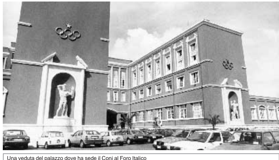
Una veduta del palazzo dove ha sede il Coni al Foro Italico

La convulsa giornata di ieri comincia con la convocazione del consiglio nazionale al quale il presidente, Petrucci, avrebbe dovuto illustrare lo statuto della nuova spa (società nella quale confluirà il Coni). Ma il governo fatica a mantenere anche queste promesse e lo statuto non arriva nella mani del presidente. Doveva partire dal ministero dell'Economia (che diventerà il tutor del Coni del futuro) la linea guida con le modalità per le designazioni del Cda della nuova azienda dello sport. E invece il documento non c'è, nonostante il Consiglio dei ministri avesse fissato al 16 settembre il termine ultimo per tutte le procedure. Un segnale inquietante che costringe il Coni ad operare senza indicazioni e soprattutto senza sapere come dovrà essere strutturata la società per azioni. Sulla nomina dei membri del Cda c'è, tra l'altro il timore che possano arrivare indica-