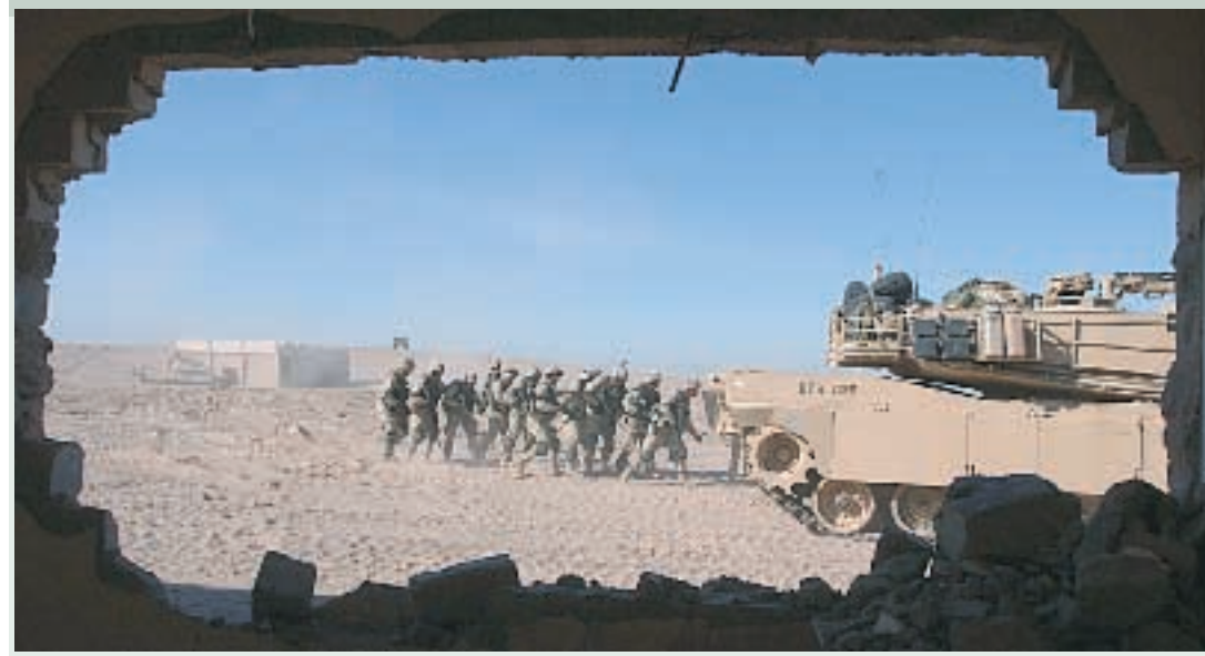
Soldati americani della divisione Alpha in addestramento in Kuwait ALLE PAGINE 12-13