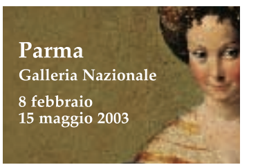
Parma Galleria Nazionale 8 febbraio 15 maggio 2003