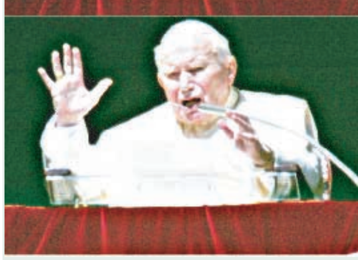
Giovanni Paolo II ieri a San Pietro