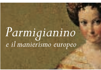
Parmigianino e il manierismo europeo

Il quotidiano l'Unità è stato fondato da Antonio Gramsci il 12 febbraio 1924