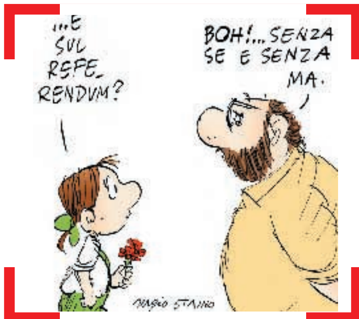
Polemica sui «Meridiani»