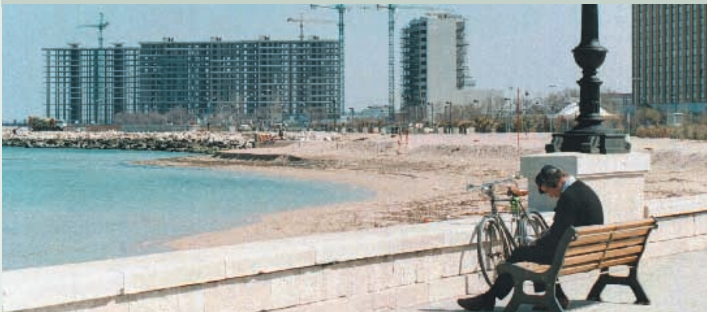
L'ecomostro di Punta Perotti a Bari