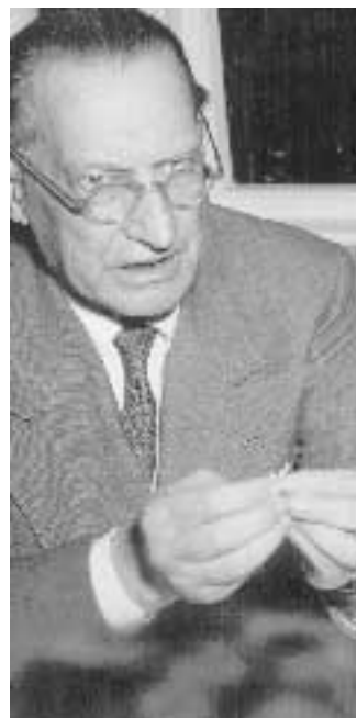
Alcide De Gasperi