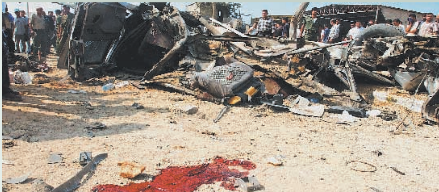
Il luogo dell'attentato nella Striscia di Gaza