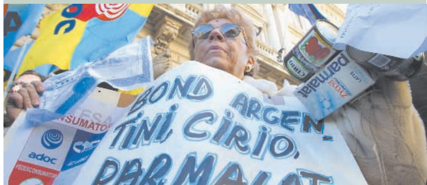
La protesta dei risparmiatori davanti alla sede di Bankitalia a Roma

Truffa-bond, per la prima volta la protesta arriva a Bankitalia