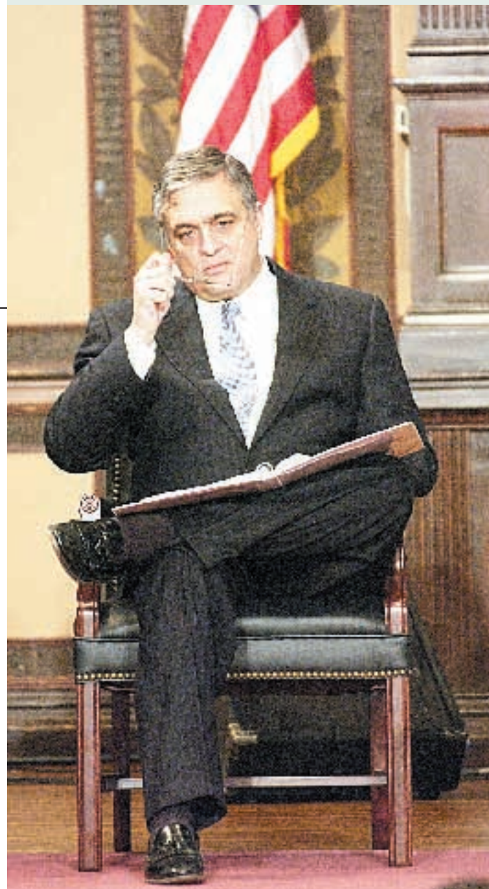
Il direttore della Cia George Tenet MAROLO A PAG. 11

La Cia: non abbiamo mai detto che le armi di Saddam c'erano