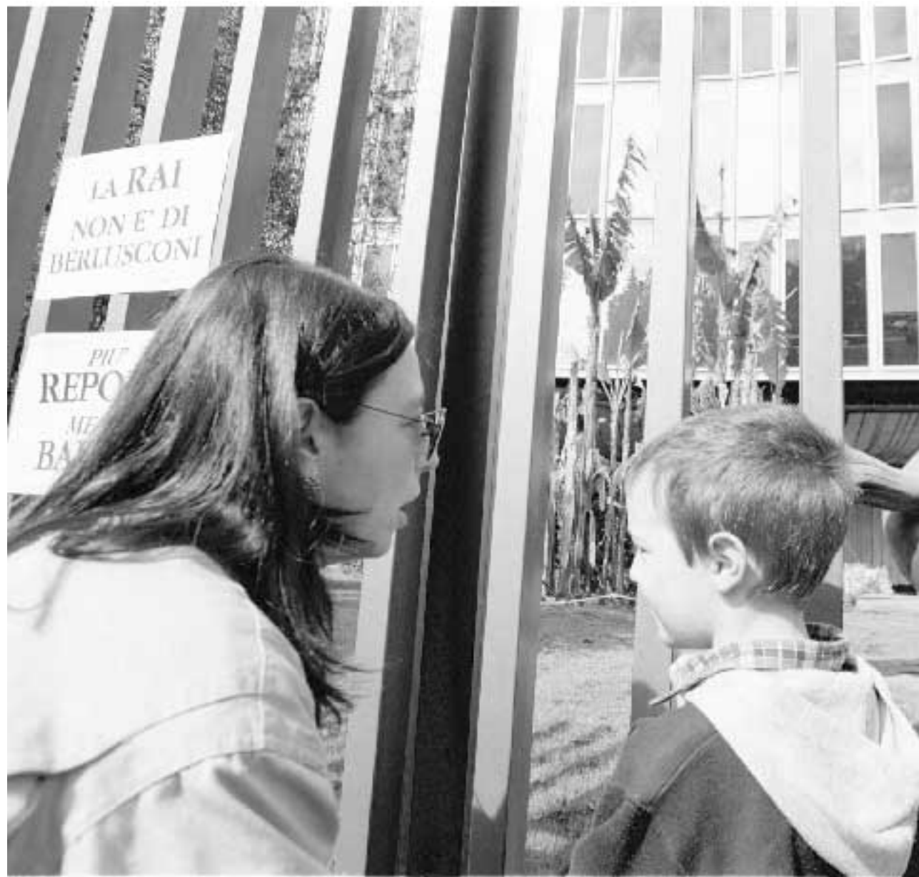
Un girotondo alla Rai per una libertà di informazione

Violante: da Annunziata una scelta giusta e responsabile contro l'indecenza