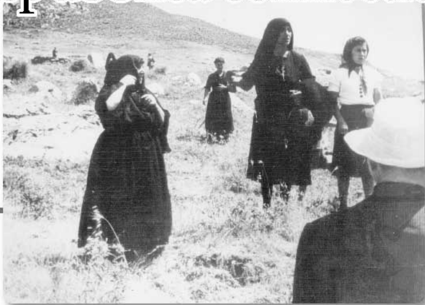
A Portella delle Ginestre dopo la strage. In basso James Angleton e Junio Valerio Borghese

Un'informazione ai servizi segreti americani scritta da un giovanissimo Andreotti in cui si riferiscono accuratamente i movimenti di De Gasperi... E c'è tutta una parte della nostra documentazione che racconta una pagina nuova sul dopoguerra. In tutte le storie della Repubblica si parla di una ripresa del neofascismo con l'ingresso dell'Msi in Parlamento nel 1948, mentre risulta che una serie di ex gerarchi sono attivi già prima della fine della guerra. Non ci sono censure. Si può parlare di un fascismo ininterrotto : mentre la guerra sta finendo, i fascisti già organizzano fronti antibolscevichi, movimenti an-