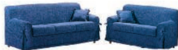
Salotto ESTASY Divano 3 posti+Divano 2 posti €350,00* L. 677.000