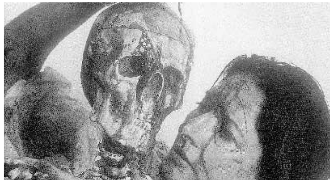
Marina Abramovic in una performance del 1995 «Cleaning the Mirror». In alto un momento di «The Biography Remix»

occasione del workshop Cleaning the House , organizzato in Spagna dal Centro Galego de Arte Contemporánea, Santiago de Compostela, il libro riassume la lunga esperienza compiuta dalla Abramovic nel campo dell'insegnamento. L'artista spiega di aver maturato la decisione di insegnare molto presto, subito dopo un workshop tenuto nel 1979 in Australia con Ulay, animata dalla convinzione che sia importante poter trasmettere la propria esperienza alle nuove generazioni. Ai suoi studenti spera di riuscire a inse-