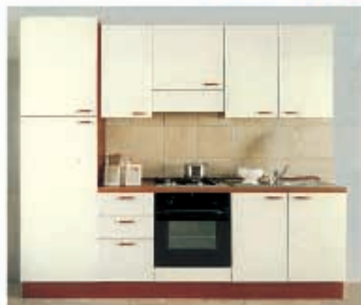
Cucina JENNY cm. 250 completa di elettrodomestici €780,00* L. 1.510.000