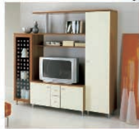
Soggiorno PRAGA €345,00* L. 668.000