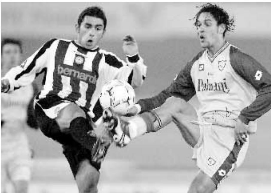
Una fase di Chievo-Udinese del campionato appena concluso. Ma la classifica potrebbe essere rivista

soltanto la seconda accusa. LE SOCIETÀ È questo l'aspetto che rischia di essere maggiormente destabilizzante per il calcio italiano qualora trovassero riscontri le ipotesi di reato formulate in questi giorni dalla procura napoletana. Una prospettiva in grado di generare un terremoto (che molti all'interno della Federazione ritengono inevitabile) in grado di riscrivere serie A, B e C con retrocessioni a tavolino e penalizzazioni. Provata l'esistenza di accordi fra società al fine di "aggiustare" i risultati e di conseguenza le classifiche, infatti, le società coinvolte sarebbero retrocesse nel campionato inferiore; per quelle già retrocesse sul campo, invece, scatterebbe una penalizzazione da scontare nella prossima stagione (un minimo di tre punti un massimo di nove). Le società oltre che per "responsabilità oggettiva" (il club risponde del comportamento dei propri tesserati) potrebbero addirittura essere chiamate a rispondere di quella che in gergo si chiama "responsabilità presunta": un club, dal punto di vista sanzionatorio, è infatti punibile per la frode sportiva compiuta a proprio favore, o solo tentata, anche da un soggetto non tesserato. Unica via di salvezza, in questo caso, sarebbe quella di riuscire a dimostrare di essere stati completamente ignari della condotta.