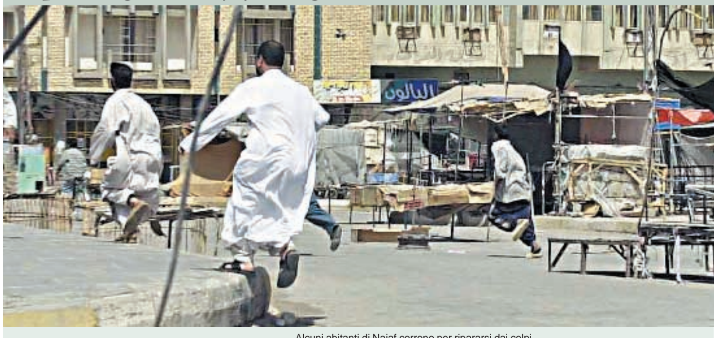
Alcuni abitanti di Najaf corrono per ripararsi dai colpi