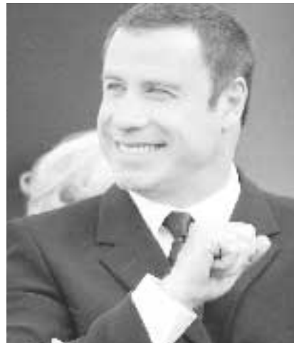
A sinistra Tom Cruise in una scena di «Collateral» di Michael Mann A destra John Travolta