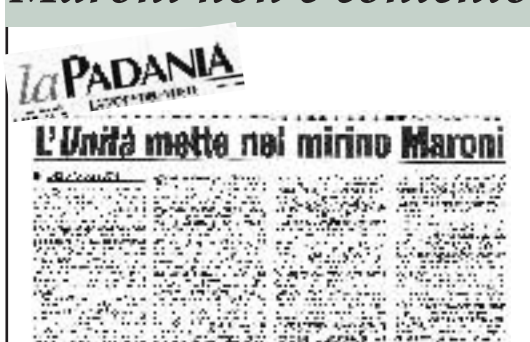
Questo titolo è apparso ieri sul quotidiano leghista la Padania. Il ministro Maroni non gradisce le critiche e chi osa farle è un potenziale terrorista.

positivi, la società dovrà ricorrere alla procedura del Capitolo 11.