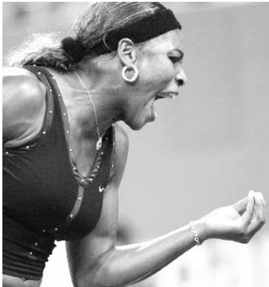
La rabbia di Serena Williams dopo la sconfitta contro Jennifer Capriati