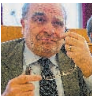
UGOLINI A PAGINA 15

Il governo sta truccando la partita fiscale. Per realizzare i tanto promessi tagli dell'Irpef, dovrà chiedere l'anno prossimo agli italiani tra i 4 e i 5 miliardi di tasse in più. Attraverso due mosse: costringendo gli enti locali ad aumentare le imposizioni e disseminando la Finanziaria di nuovi balzelli.