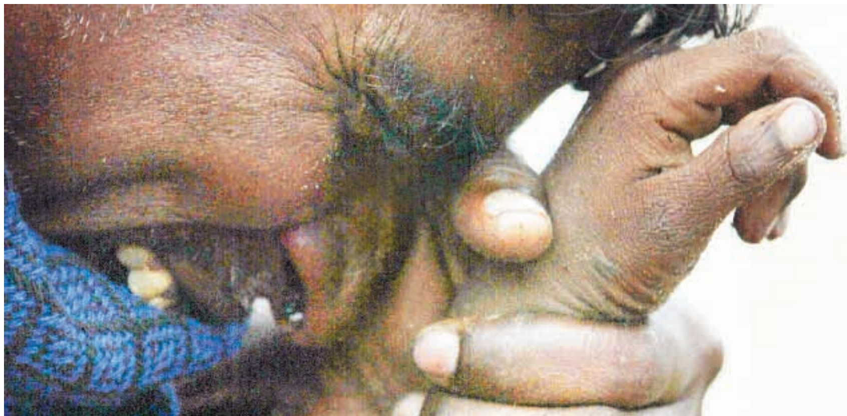
Un padre indiano piange stringendo la mano del figlio di otto anni ucciso dallo tsunami a Cuddalore, 180 km a sud di Madras

l'Unità si è trasferita a via Benaglia 25 00153 Roma tel. 06.58557.1