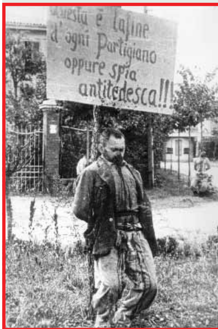
Partigiano ucciso dalle bande fasciste CANETTI A PAGINA 10