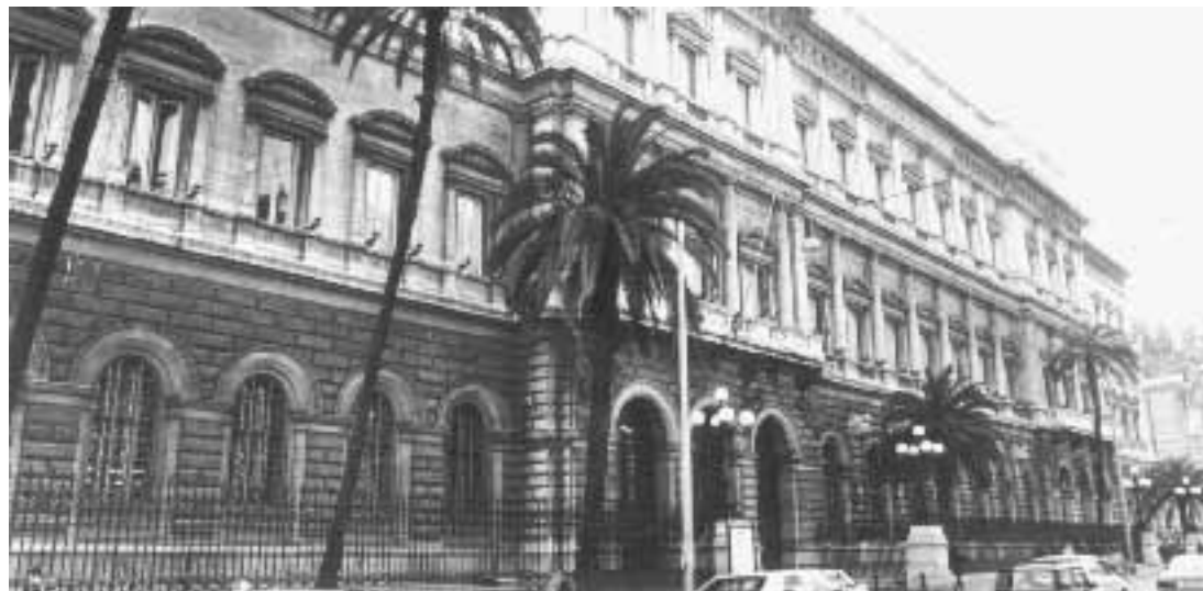
La sede della Banca d'Italia

L'investimento in azioni da parte di tre magistrati bresciani potrebbe dirottare il procedimento a Venezia