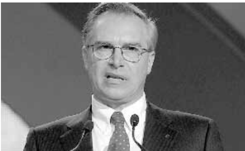
Guglielmo Epifani

Gli ultimi dati Inps si riferiscono al primo aprile scorso, a quella data erano arrivate complessivamente 36.602 domande di cui 25.966 accolte, 8209 sono da esaminare. Delle domande presentate presso gli sportelli Inps, 744 portano il timbro di settembre, prima quindi dell'emanazione del decreto attuativo; 19.383 sono state presentate nel mese di ottobre; 4.530 a novembre e 5.595 a dicembre. Il trend è decisamente in calo: a gennaio di quest'anno sono state presentate 2.336 domande, 1.935 a febbraio e 2.179 a marzo stabilizzandosi su una media di circa 2.000 richieste al mese. «Mese dopo mese -