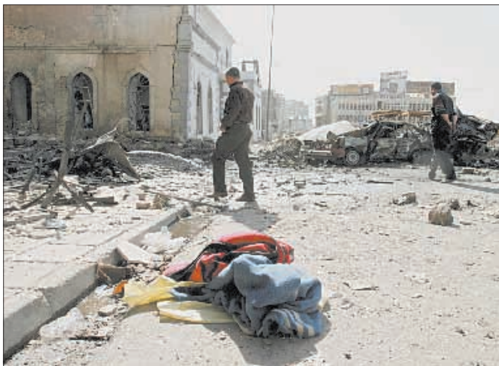
L'attacco suicida ieri a Mosul che ha provocato morti e feriti

LA CONFERMA arriva dal Pentagono. È Rumsfeld ad ammettere che la notizia pubblicata da un giornale inglese è vera: l'America di Bush ha avviato una trattativa con i ribelli iracheni. Ieri nuova raffica di attentati, 40 i morti