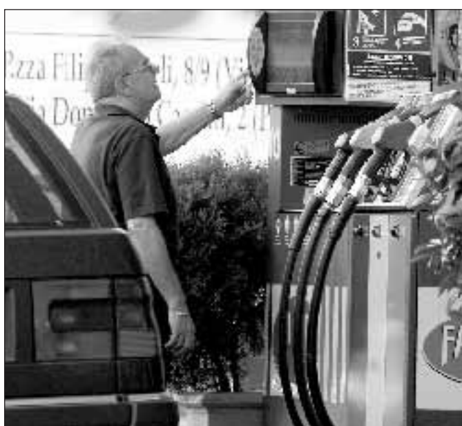
Un automobilista osserva il prezzo del carburante

primato di 1,138 si è portata anche l'Api (a 1,139). La situazione dunque si fa sempre più pesante: basti pensare che per un pieno di un'auto di media cilindrata ci vogliono ormai 63 euro. Ma il problema non è solo degli automobilisti, perché l'aumento della benzina pesa in generale sull'inflazione. Adusufed e Federconsumatori hanno infatti calcolato che al rincaro complessivo di 255 euro per famiglia dovuto al