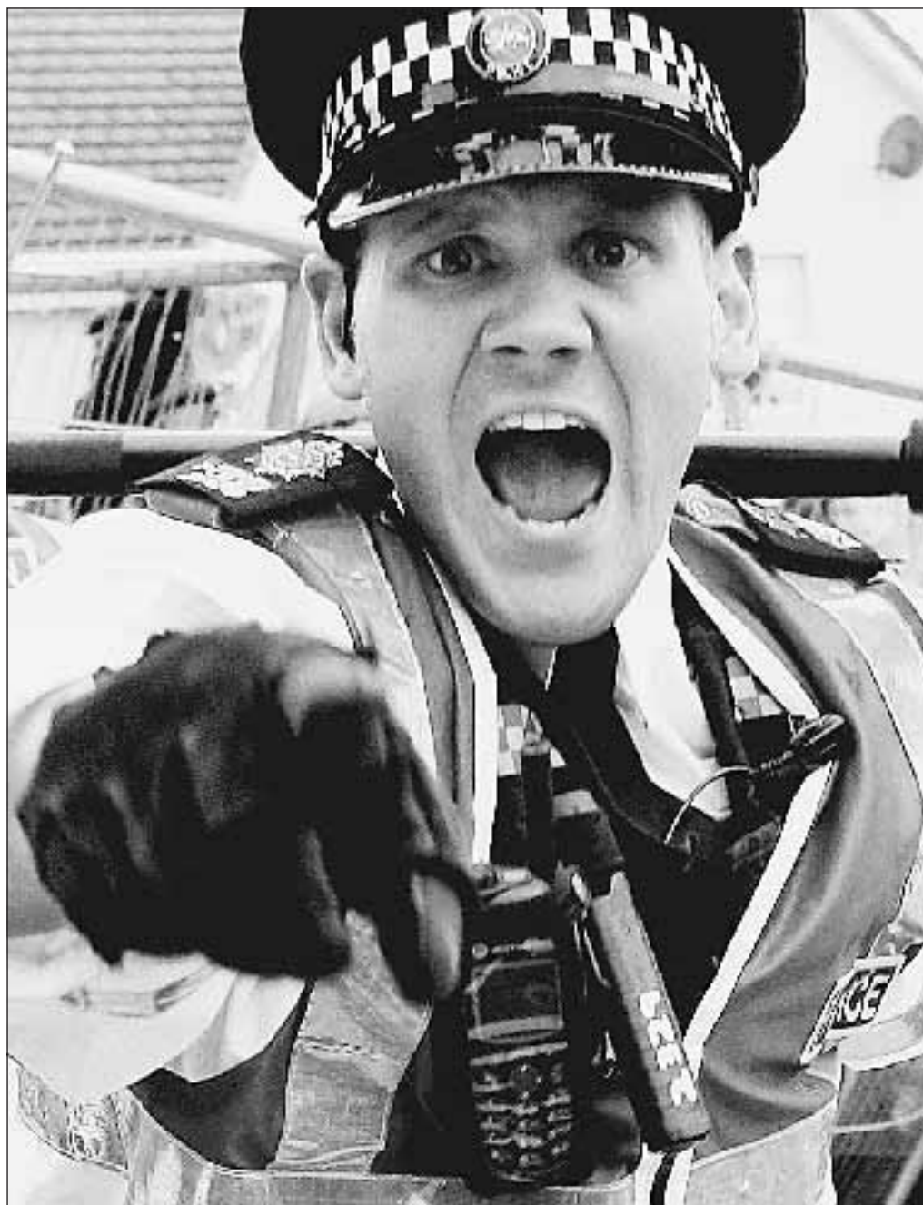
L'urlo di un poliziotto contro i giovani che manifestavano a Gleneagles in Scozia.

I giovani arrivati a Edimburgo non sono tantissimi. Certo non il milione atteso