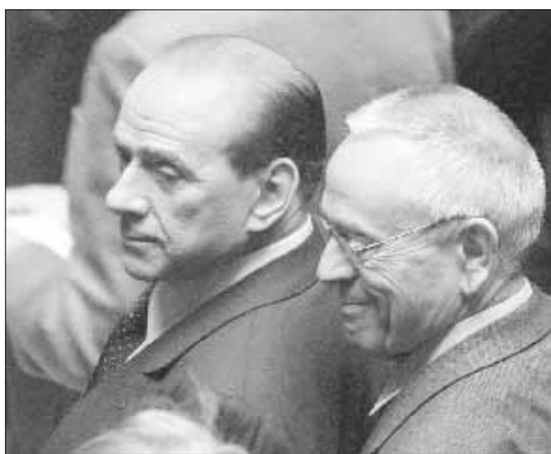
Il presidente del Consiglio Silvio Berlusconi e Cesare Previti.

munque, in discesa, come vorrebbe Fi, perché i motivi di contrasto, nella Cdl, permangono tutti. È vero che la Lega si è ammansita, ma molti dubbi serpeggiano ancora tra gli altri alleati, An e Udc, soprattutto. Tanto è vero che, dopo il silenzio mantenuto alla Conferenza dei capigruppo sulla proposta di Schifani di riesumare il discusso provvedimento, ieri, in aula, nessun esponente dei centristi ha difeso il nuovo calendario, mentre il vice capogruppo di An, Oreste Tofani, ha pronunciato un intervento di «apertura», assicurando che «nulla è blindato». Vedremo alla prova dei fatti, se queste «aperture», abbozzate dallo stesso Schifani, si tradurranno in emendamenti modificativi o saranno solo chiacchiere. Lo stesso Presidente del Senato si era, d'altra parte, mostrato piuttosto riottoso a questa forzatura del calendario. Potrebbe anche intervenire una nuova interruzione dell'iter del provvedimento, tanto più che, come ha segnalato il capogruppo ds, Gavino Angius, proponendo la cancellazione dell'ex Cirielli dal calendario, l'assemblea di Palazzo Madama dovrà esaminare, prima della pausa estiva, importanti provvedimenti come il Dpef,