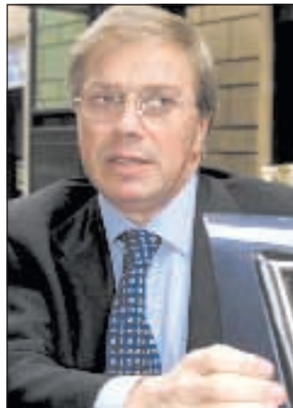
Fantozzi a pagina 3

Castagnetti: dobbiamo essere alternativi a loro