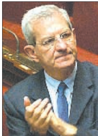
Collini a pagina 3

Violante: ora pensiamo a salvare il Paese