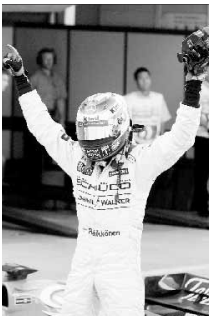
L'esultanza di Kimi Raikkonen.