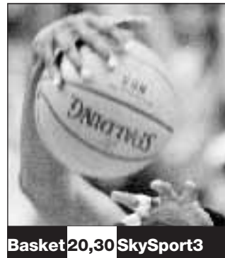
Basket 20,30 SkySport3