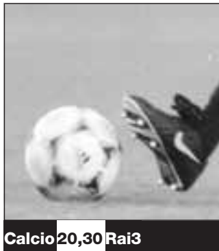
Calcio 20,30 Rai3

Se la Francia non vincerà il campionato del mondo in Germania una delle ditte autorizzate rimborserà interamente il prezzo delle maglie dei "bleu" vendute a novembre. L'operazione promozionale è di "Made in Sport" che ha previsto di vendere 2mila magliette a 60 euro l'una