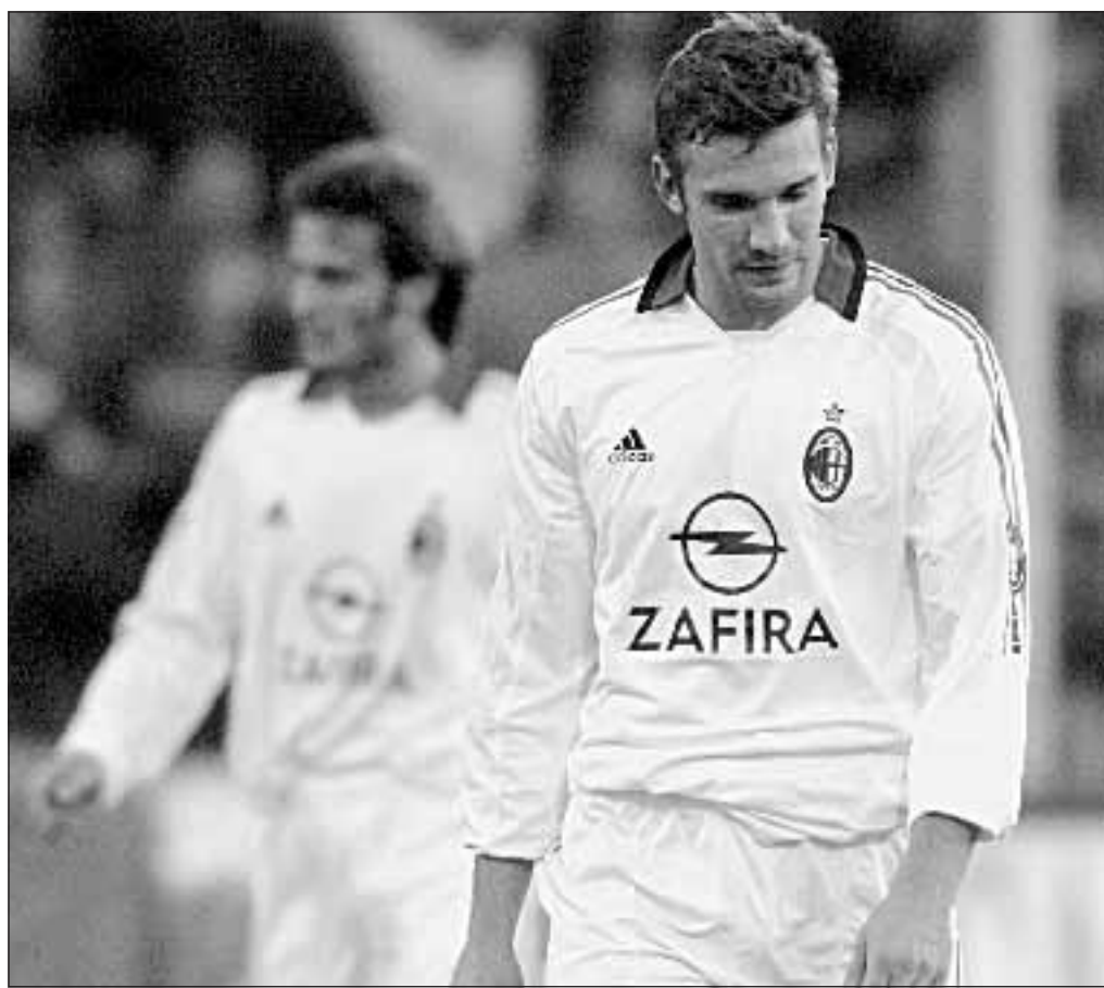
Gilardino e Shevchenko delusi dopo la sconfitta contro la Fiorentina