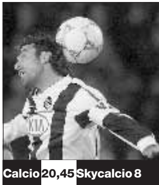
Calcio 20,45 Skycalcio 8