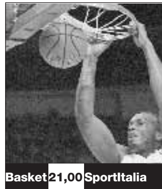
Basket 21,00 Sportitalia