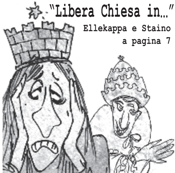
"Libera Chiesa in..." Ellekappa e Staino a pagina 7