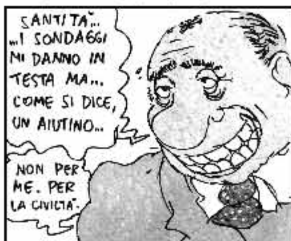
Con il Premier nato e nato che di Sturzo si fa vinto c'è una grande stanzina in odor di simonia