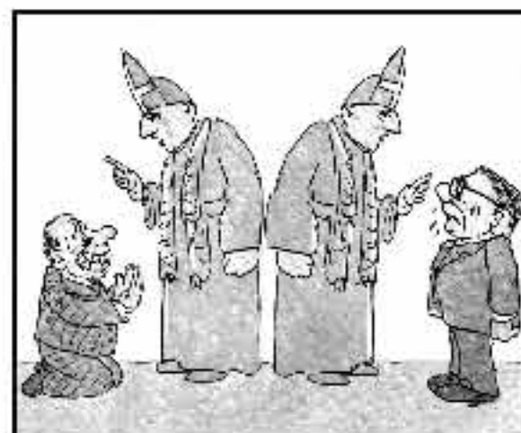
Sii devoto al cardinale c'è la sfida elettorale se vecchia l'obsequenza ti rima l'assistenza!