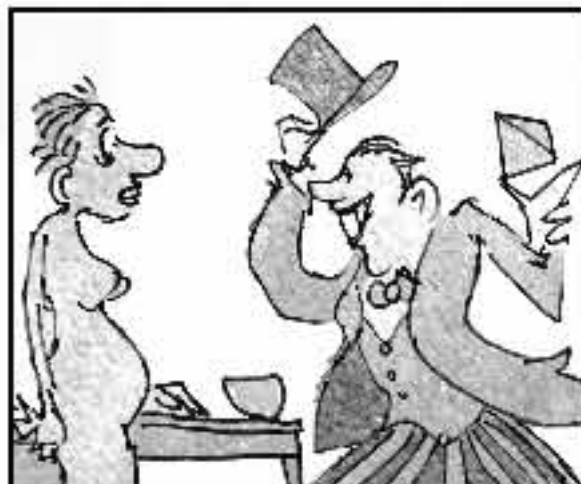
Non hai casa nè guadagno? Ti ha snipata il tuo compagno? Meti al mondo il tuo bebè, poi ci pensa la Nestlé