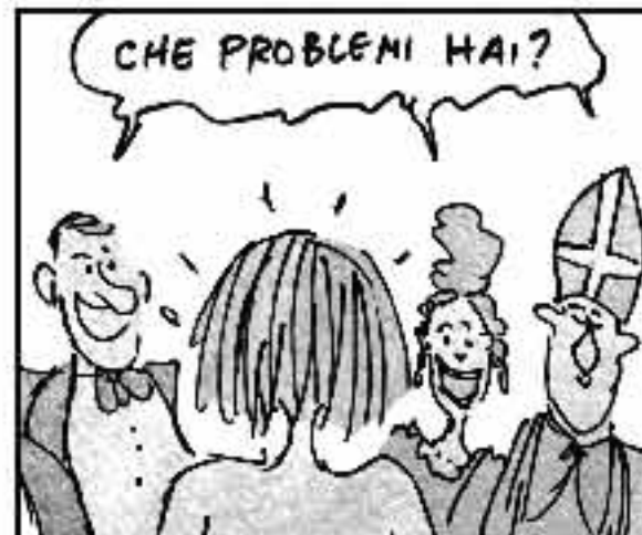
Se il bebo fosse una pupa poi ci pensa la Milupa Se per caso fosse gay lo farà sentir la CHI