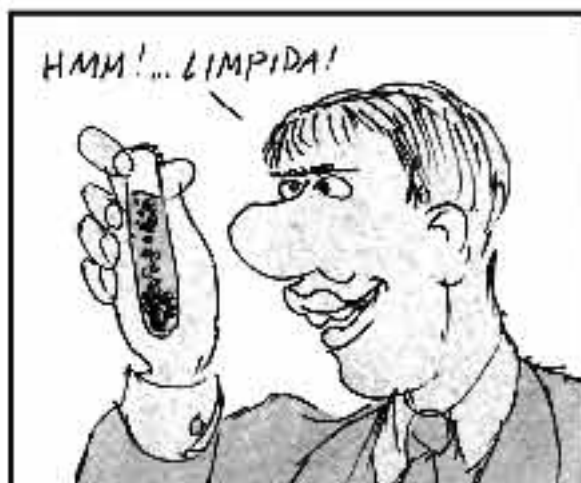
Ossequente coi madron (sia la chiesa o Berlusconi) fa passare ogni schifozza con la massima purezza