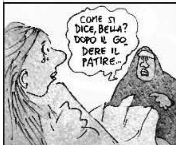
Troppo comoda la pillola che ti el mina la cellula! A espiatione e pentimento più si addice l'abbramento