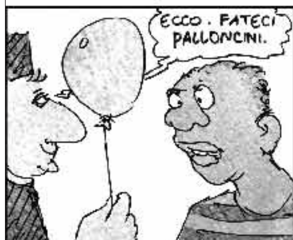
Il condom, che scaviglio, c'èto meglio un bel contagio. Non l'ha restare vivo? Tutto quanto è relativo