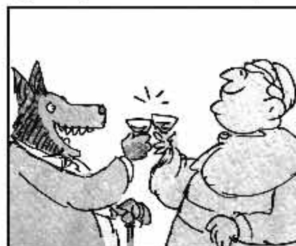
Intelligenza, pace, amore... Ma che lag na! Che fervore! Quel Brennesca è rospa capo, io, ragazzi, sto col capo!