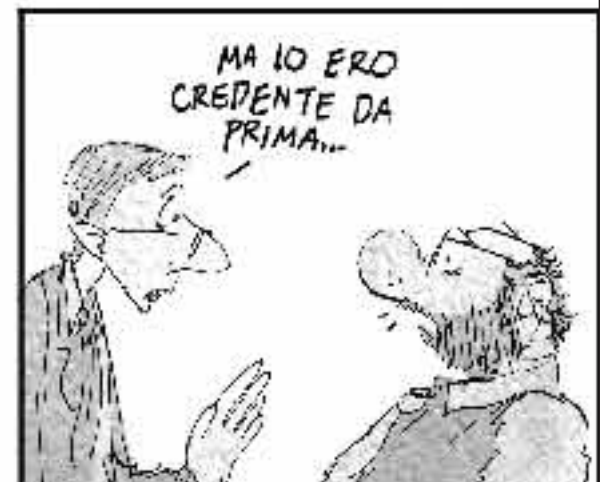
Pur l'assine e Berninotti si riscoprono bigotti pesi son dal trascendente molto trendy esser credente!