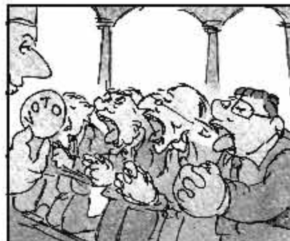
La ventata clericale per l'Unione è già finita ma reagisce con gran stile: si converte in baciapile