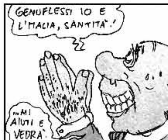
Sen tedesco, mica fesso, Voglio Silvio genuflessi! E alla prima maratona ti economico Apicella