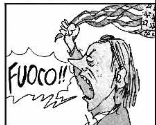
L'atici, frati, protestanti, normalizzo tutti quanti! E gli islamici incapaci li consegna alla Bellaci