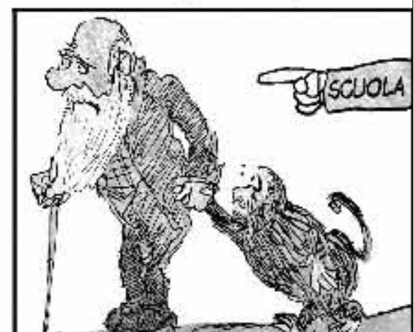
Nella Pubblica Istruzione sia obbligata religione, creazionismo ed altre balle Daruia fuori dalle palle!