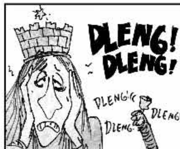
L'eterologia? Non val La Cirilli? Focola qua! Scamparella in allegria come fosse in sacrestia