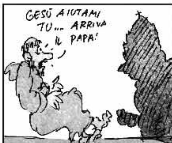
Le smarrite pecorelle le spranocchio senza pelle. Mi son tutto i garbati di quei fazi, in que ci Asses