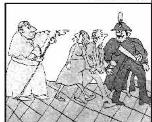
L'eterologia è peccato? colto fatto l'è già un reato! Non si scherza con l'arbitrio Su, figliolo, va' in prigione!