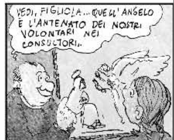
Senza l'ombra di ingenuità per la donna in gravidanza he già aperto un consultorio proprio dentro l'ortorio