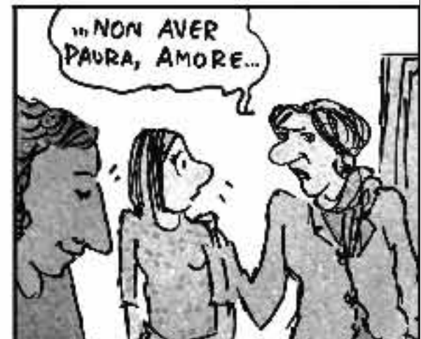
Senza aborto è molto meglio clandestino sia il tuo taglio o alla nona settimana ti rivo gli alla mammara