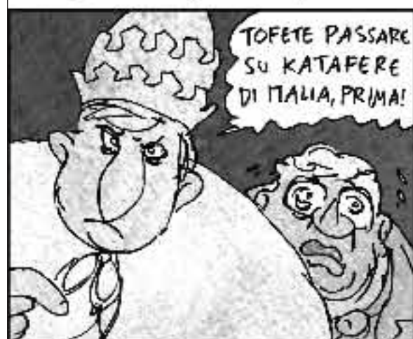
Il potere temporale senza liquidi va male. Moralisti, dis che strazio! Ciù e mani cal mio Fazio