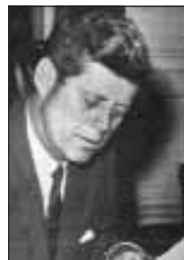
J. F. Kennedy

la distruzione delle città in mezzo in Belgio, Olanda e Germania, e un analogo lancio di missili nucleari Nato sulla Polonia, lungo la Vistola, per impedire il passaggio dei rinforzi dell'armata rossa verso il fronte. Il nuovo ministro della Difesa polacco, Radoslaw Sikorski ha usato i documenti per denunciare come Mosca intendesse cinicamente «sacrificare la Polonia»: «Alle forze armate polacche veniva chiesto di prendere parte ad un'invasione che avrebbe portato alla distruzione della Polonia». Ma la cosa ancora più agghiacciante è che ora sappiamo che la distruzione nucleare di mezza Europa da parte di uno dei blocchi militari, e dell'altra metà da parte dell'altro, pur portata a termine con le migliori e più altisonanti intenzioni - impedire l'annientamento della propria «civiltà» minacciata dall'avversario - non sarebbe servita assolutamente a nulla, avrebbe distrutto entrambi, che quello specifico conflitto,