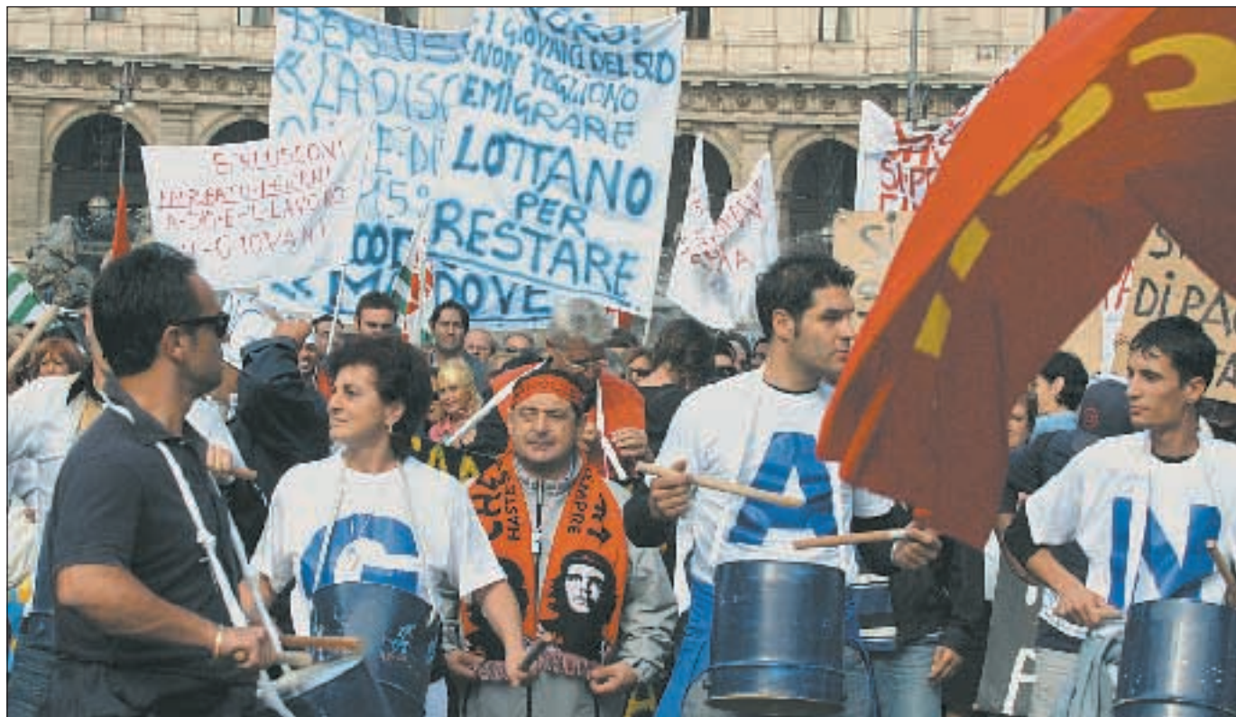
Una manifestazione nazionale dei lavoratori metalmeccanici