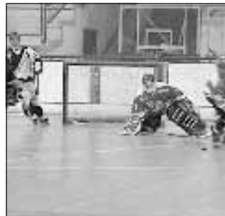
Hockey 20,40 SkySport2

Il Dubai debutterà nella Coppa del Mondo di sci. Nell'Emirato è stato costruito, con vista sulle dune del deserto, un mega snow-dome grande quanto cinque campi di calcio ed alto come un palazzo di sei piani. Il tutto condito da ottima neve artificiale