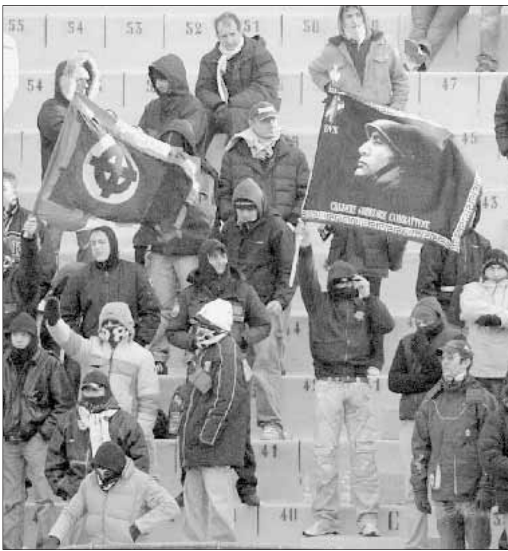
Croci celtiche e un busto di Mussolini esposti dai tifosi livornesi allo stadio di Livorno.