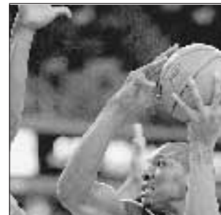
Basket 21,00 Sportitalia