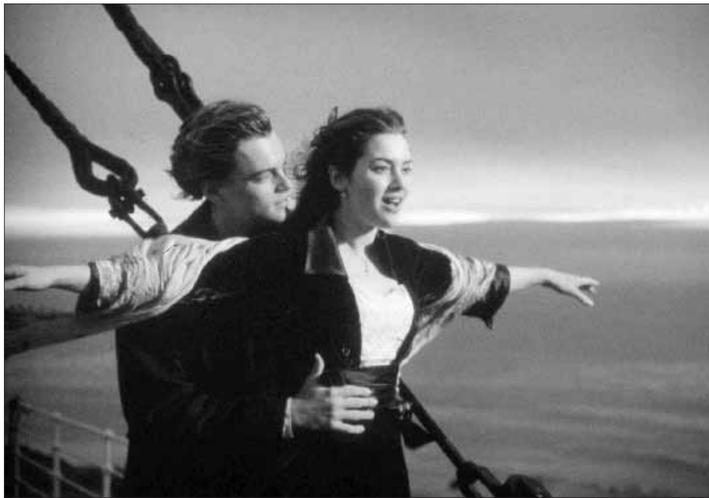
Leonardo Di Caprio e Kate Winslet sulla prua del Titanic

I dvd compie 10 anni e diventa adulto. Il vhs (la vecchia videocassetta, nata nel 1976) sta per compiere 30 e probabilmente è morto. Chiuso abbia maneggiato questi due supporti per il cinema «casalingo» conosce la differenza e sa di che cosa stiamo parlando. Il vhs è fragile, rozzo, di qualità modesta, altamente deperibile. Il dvd è solido, agile, di ottima qualità e si conserva inalterato nel tempo. Di più: il dvd può immagazzinare nello spazio di un dischetto digitale una quantità di informazioni infinitamente superiore a quella del vecchio nastro. I dvd contengono anche la possibilità di vedersi i film in originale con sottotitoli, e gli ormai mitici «extra»: docu-