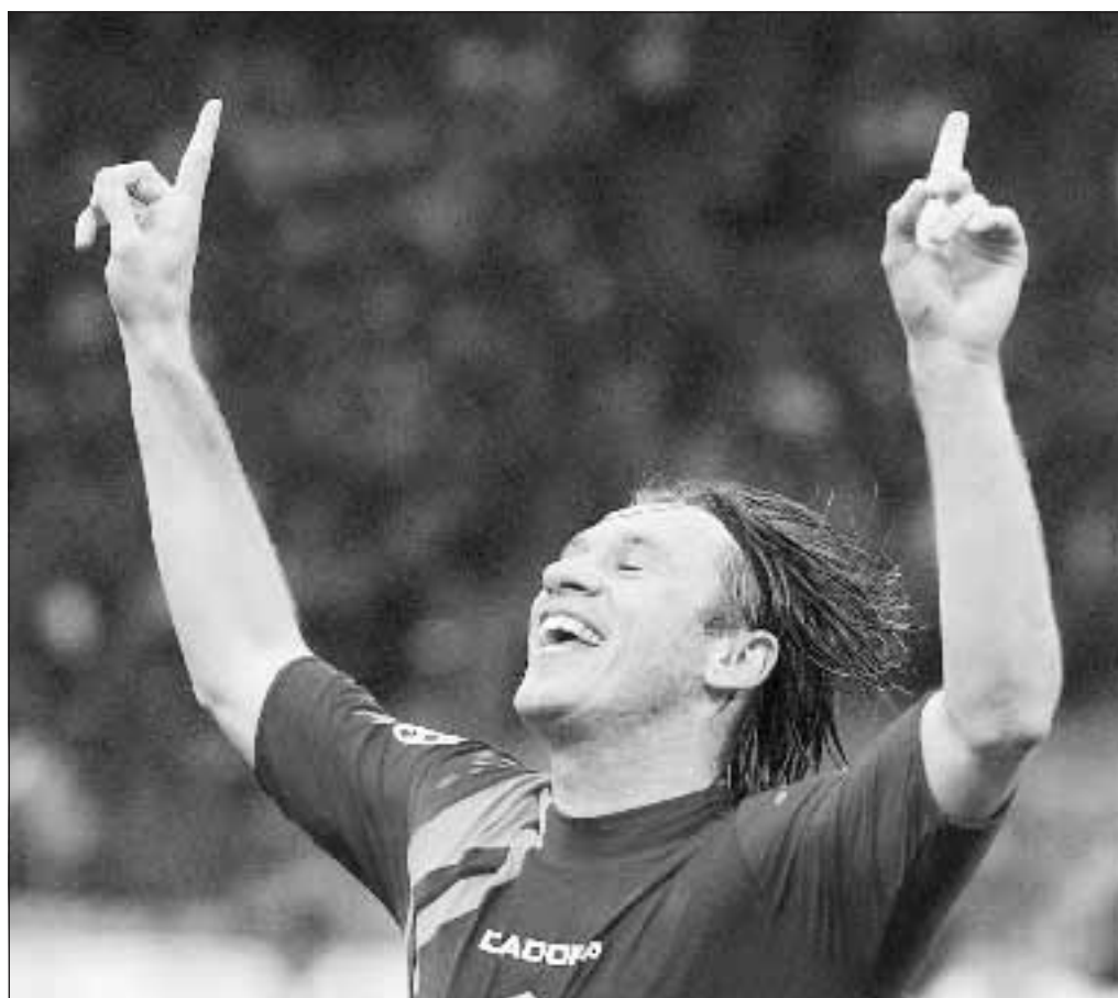
Antonio Cassano