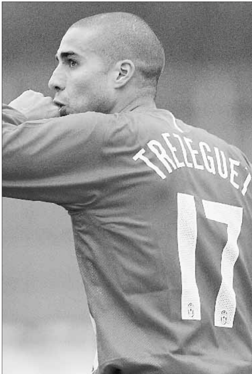
David Trezeguet festeggia dopo aver realizzato il secondo gol.

Con il risultato in ghiaccio già prima del 20', per la Juve il resto della partita è stata accademica allo stato puro, con diverse occasioni per arrotondare ulteriormente il punteggio. La rete di Ferrante alla mezz'ora, arrivata al termine di una bella azione in velocità condotta dal vivacissimo Foggia, ha illuso l'Ascoli e il pubblico di casa solo per qualche istante, perché da lì in avanti Buffon è rimasto sostanzialmente inoperoso. Alla fine anche l'incontentabile Capello ha vestito i panni del buonista: «Ho visto 20-25 minuti di grandissimo gioco all'inizio. Non potevo chiedere di più, la squadra ha assorbito benissimo la sconfitta con la Roma». Il tecnico bianconero si è detto persino convinto che il caso Zebina rientrerà: «È un ragazzo puro, spontaneo, era meglio che non dicesse certe frasi, ma certamente troveremo un punto d'accordo».