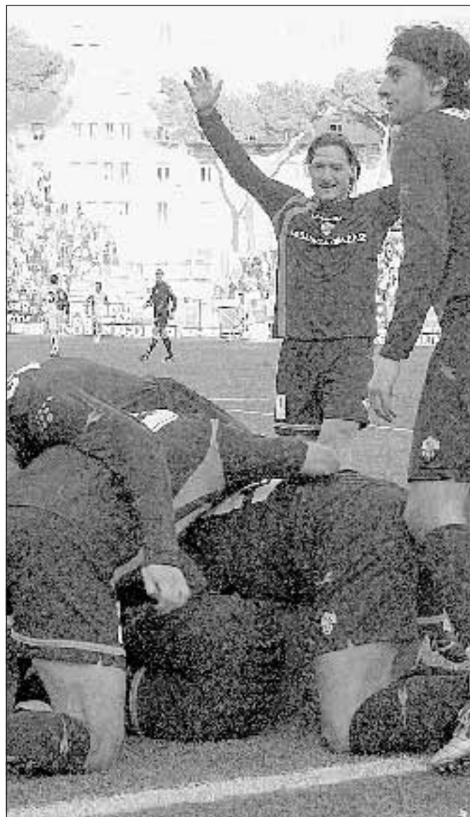
La gioia dei giocatori della Roma dopo il secondo gol.

gale braccia: non è giornata. Esce Taddei, ex fischiatissimo, ed entra Tommasi. Di lì a poco, come detto, De Rossi troverà il varco giusto e addio resistenza bianconera. Il raddoppio, a tempo scaduto, è un regalo formato famiglia del portiere casalingo Fortin. E hai voglia a polemizzare con l'arbitraggio.